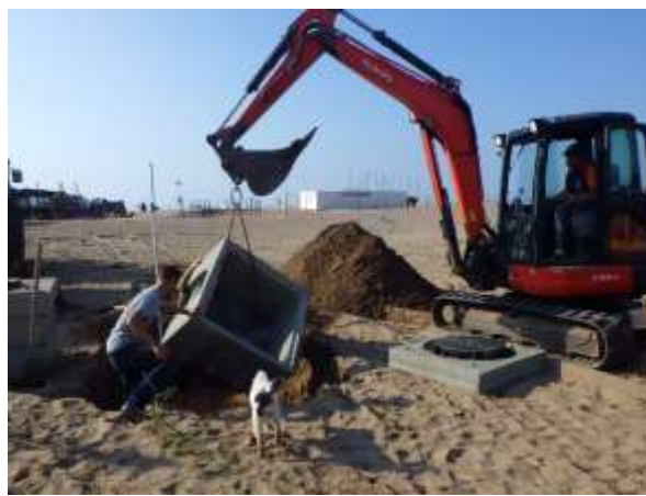
Pose des prises d'eau dans la lagune à 0.50 m Ngf et de la chambre de vannage. Les tubes annelés DN 400 sont scellés tous les 10 mètres avec des rondins de bois traités.