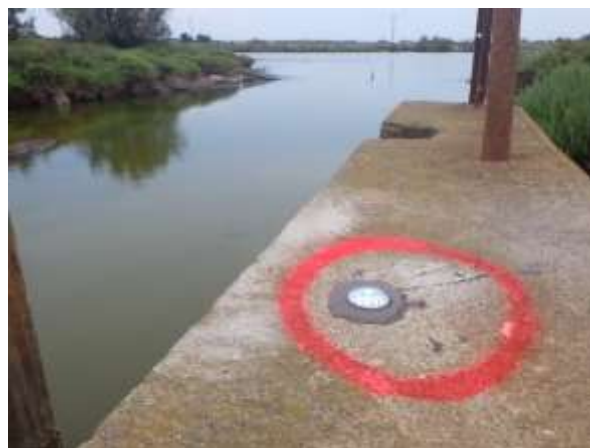
Pose de repères altimétriques à partir du réseau national de IGN.