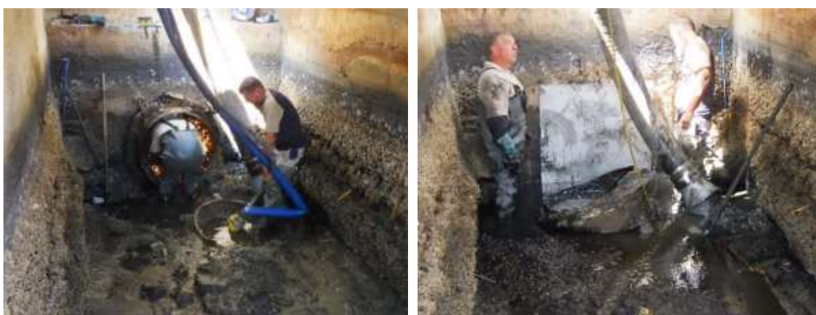
Découpe de l'ancien clapet et fixation d'une plaque en inox