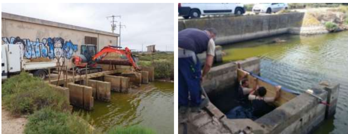
Réalisation de batardeaux en amont et aval de la station des Drilles

Des eaux salines de la Grande Maire s'infiltraient en grande quantité sous le bâtiment pour rejoindre le ruisseau de Serviès. La raison était un clapet défectueux. L'entreprise Suez a été sollicité pour déposer du clapet situé sous la station et le remplacer par un panneau en inox.