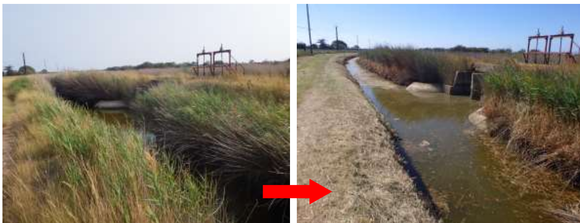
Roubine de la Prade (Portiragnes) avant et après intervention