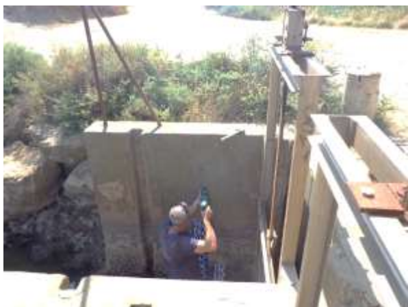
Pose des échelles limnimétriques : station les drilles (en haut), station Madelène (en bas)