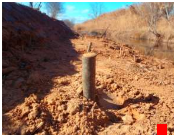
Plantation de boutures de saule sur la banquette récemment aménagée.