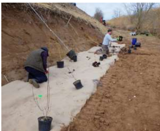
Plantation d'arbres et arbustes (1U/m 2 )