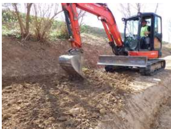
Scarification de la banquette pour enlever les rhizomes de canne de Provence et ronciers