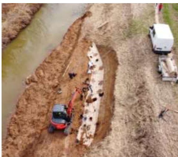
Réalisation d'un bosquet sur la berge du Lirou

Réalisation de 2 bosquets soit 120 m 2 et 125 plants fournis par des pépiniéristes locaux.