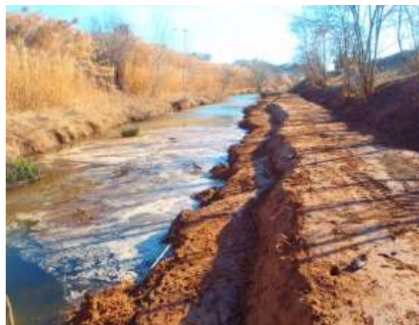
Reprofilage du pied de berge et création d'une banquette submersible, avant et après intervention