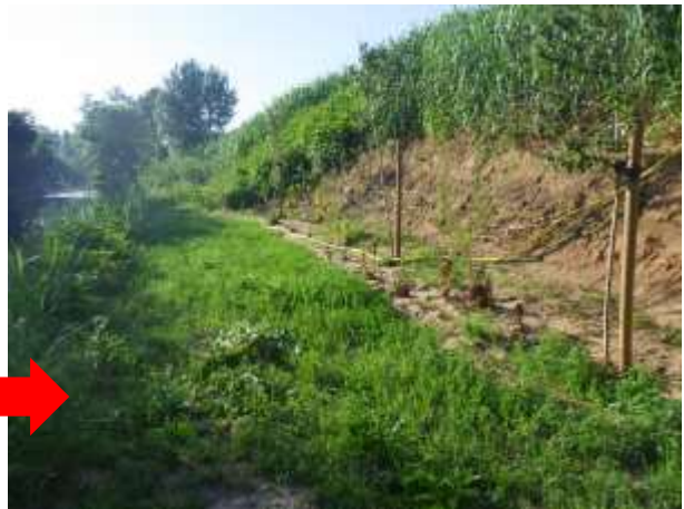
Reprise de la végétation, vesce, luzerne, treffle couvrent la nouvelle banquette