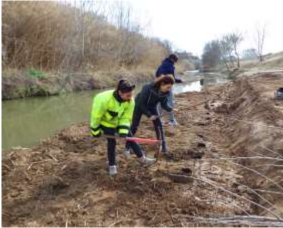
Les bénévoles en action, plants forestiers en pied de berge.