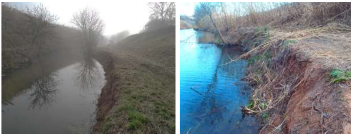
Etat actuel : effondrement de la banquettes et érosion des berges du Lirou

Soumises aux inondations de l'Orb et du Lirou, les berges présentent de nombreuses érosions. Cette situation est accentuée par la prolifération d'espèces végétales invasives (Cannes de Provence, ronciers..) qui ne permettent pas le développement d'une ripisylve adaptée pour la stabilité des berges.