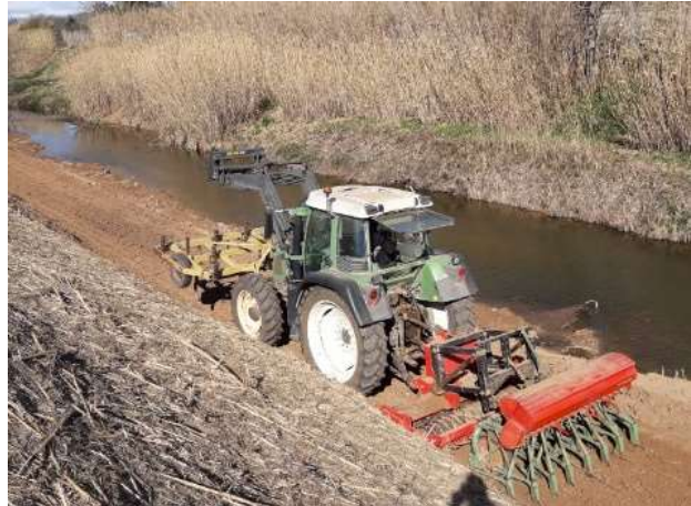
Semi sur risberme en fin chantier