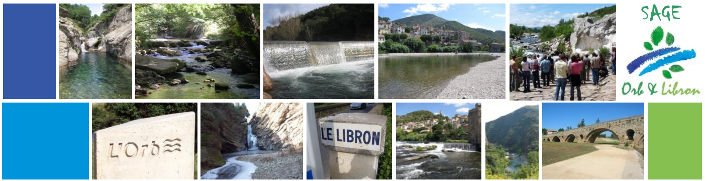
Schéma d'Aménagement et de Gestion des Eaux des Bassins de l'Orbi et du Libron

Rapport de synthèse de la consultation des institutions